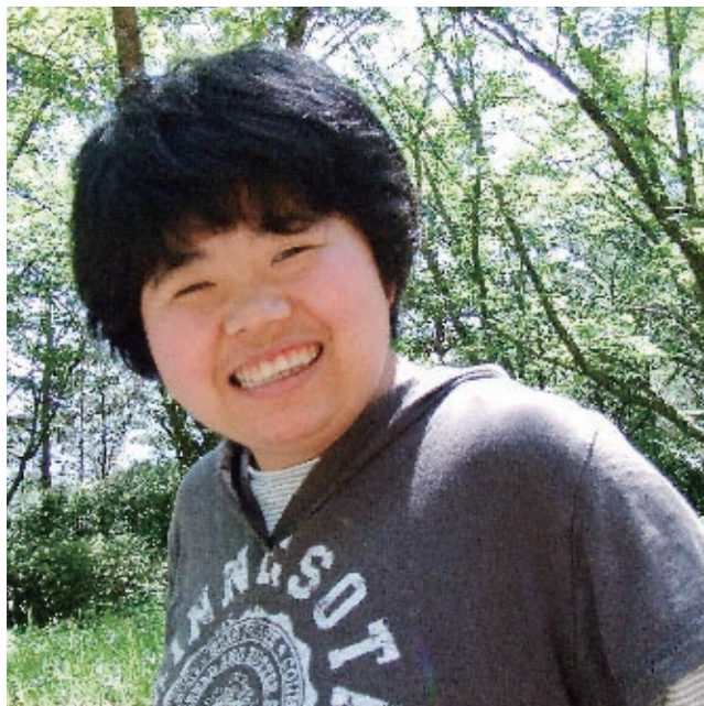
ケアホームそらいろ・あんず より