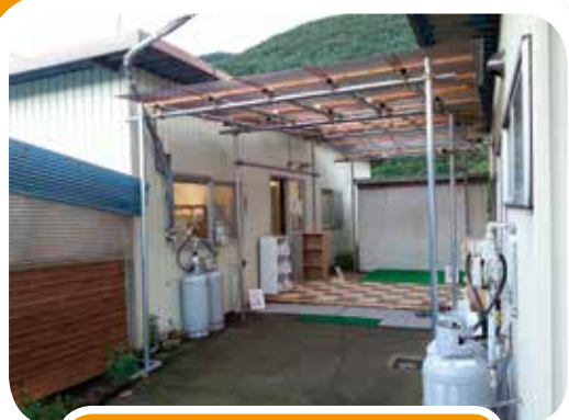
ゆったりワークスペース MOKU