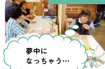
パッチワークなど