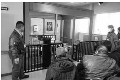
●長野市防災市民センター様●

見学に参加された方々から、「とても勉強になった」「やさしく教えていただき、嬉しかった」等の感想がありました。事業所見学で学んだこと・感じたことを、今後の就労訓練や生産活動に活かしていきます。