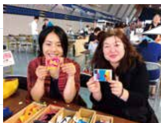
大人の文化祭 (ワークショップ)