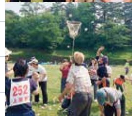
障害者スポーツ大会