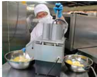
スライサーでりんごを切っています。