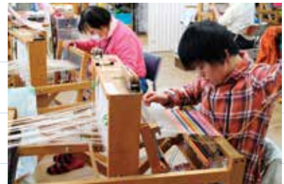
みなさん黙々と作業しています。