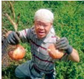
特大玉ねぎがたくさん収穫できました!