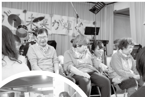
トーンチャイム いい音♪

その中で、かりがねフェスティバルに発表する事を目標にし、すこしづつ練習を重ねてきました。トーンチャイムはとても素敵な音で皆、気持ちもリラックスします。今年は“ふるさと”をみんなで演奏しました。手話を付けて“切手のない贈り物”も歌いました。緊張したけれど、良い発表になったと思います。