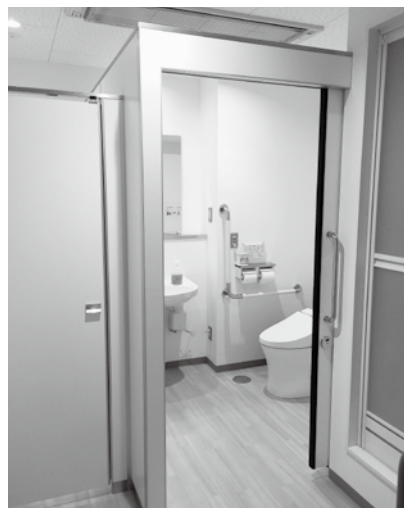
トイレ (車椅子対応あり).EPS

ミライエの間取りは広い一つのスペースを学習スペースと身体を使って遊べるスペースの二つに分けています。音などの刺激が苦手なお子様も過ごせるような個室もあります。また、場所は真田の中心であり、近くには福祉センターや図書館、公園やプールといった様々な社会資源に恵まれ、運動やレク、読書などの活動の際に活用させて頂いております。開所したばかりで皆さまからの多くのご支援が必要な事業所ではありますが今後ともよろしくお願い致します。