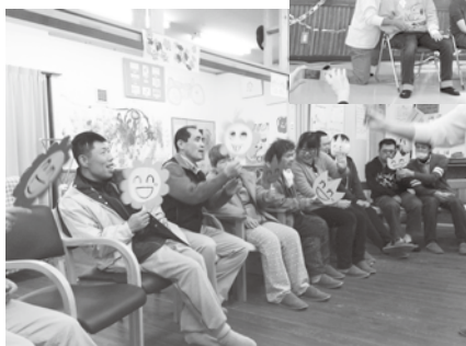
曲に合わせて小物も出てきます。