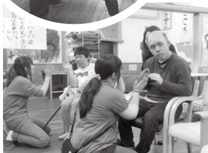
その日の調子に合 わせて座って参加