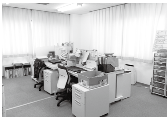
2F つつじ (相談支援事務所)