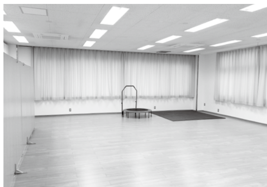
1F 指導訓練室 (プレイルーム)