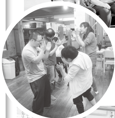
歌いながら体も 動かします。