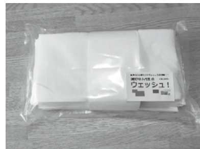
家庭用ウエス「ウエッシュ！」 1パック（55枚入）¥100

また、引き続き工業製品用ウエス販売も行っておりますので、関係企業にお勤めのお知り合いがいらっしゃいましたらぜひご紹介ください。サンプルをお持ちしてすぐにご説明にあがります。