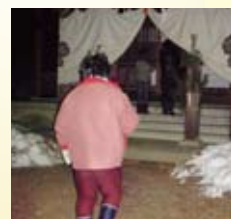
宮原神社(曲尾地区)

1月3日(金)／全員初詣へ行ってきました。 毎年サポートセンターは生島足島神社・北向観音・真田神社と三箇所の中から 行きたい場所をご自分で選んで頂き参拝へ…。お昼は美味しいものを食べて戻 られました。